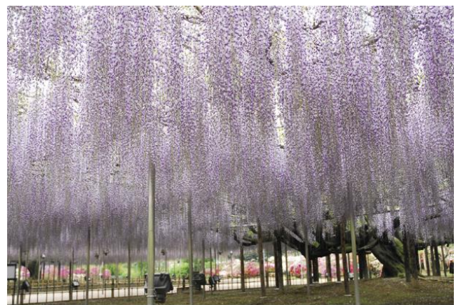
あしかがフラワーパーク 大藤

2023年4月17日以降、お客様の都合により旅行契約を解除した場合には、所定の取消料を申し受けます。