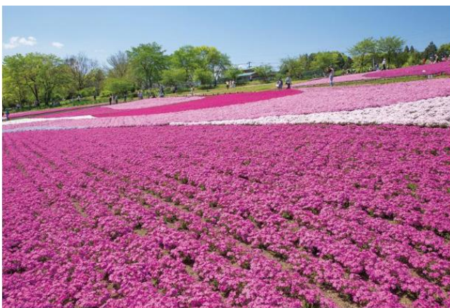
秩父・羊山公園芝桜の丘